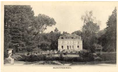
Le château des Bosquets