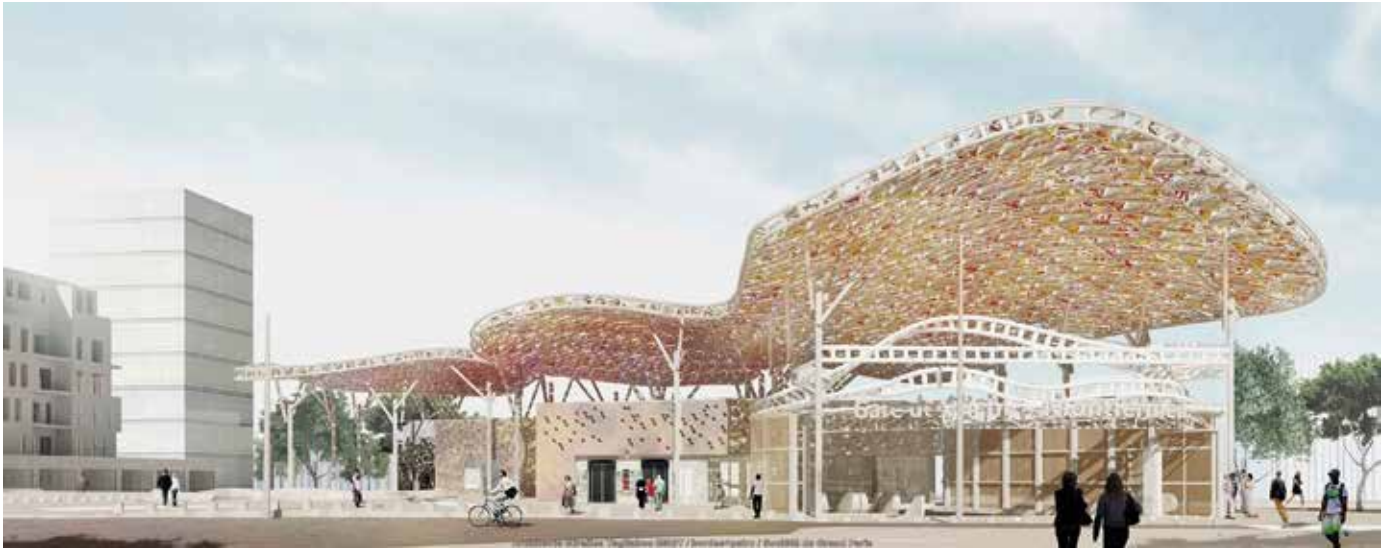
La future gare Clichy-Montfermeil de la ligne 16.