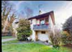
Montfermeil - Franceville 90m 2 hab, 3chambres, 859m 2 de terrain, chauffage elec DPE NC 298 000€*

Exemples de biens à la vente pour le mois de Février 2025