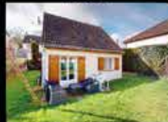
Montfermeil - Arboretum 62m 2 hab, 2chambres, 365m 2 de terrain, chauffage elec DPE D 259 000€*