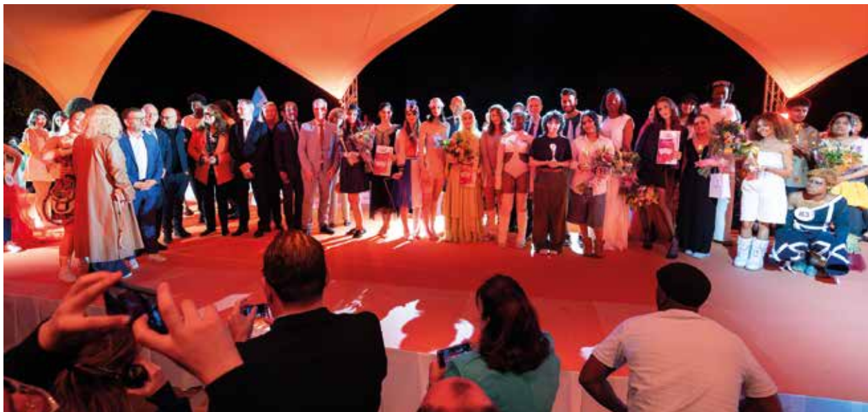
25 mai 2024 - Les lauréats et partenaires de la 19 e édition.

Créé six semaines seulement après les émeutes d'octobre 2005, le Défilé des Cultures (devenu depuis Culture & Création ) événement fédérateur et immédiatement populaire, a permis de réconcilier les Montfermeillois et restaurer l'image de la ville. Plus que jamais plébiscité, il reste un moment de création collective fait de rencontres, d'échanges et de partage, aimanté par des valeurs humaines qui vont bien au-delà d'un simple défilé de mode et participent pleinement à l'identité et à l'esprit de résilience de la ville.