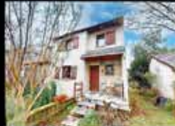
Montfermeil - Franceville 100m 2 hab, 3 chambres, 228m 2 de terrain, chauffage gaz, DPE NC 283 000€*