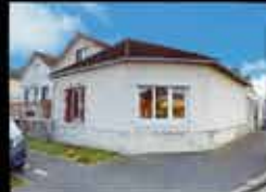
Montfermeil - Franceville 59m 2 hab, 2 chambres, 99m 2 de terrain, chauffage elec DPE E 165 000€*