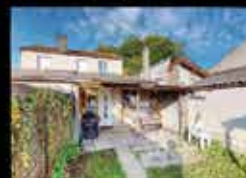
Montfermeil - Franceville 30m 2 hab, 250m 2 de terrain, chauffage Elec, DPE E 129 000€*