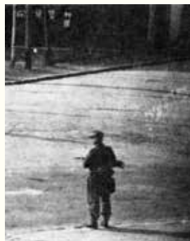
← 27 août 1944 La dernière sentinelle allemande aperçue à Montfermeil.