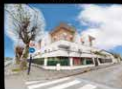
Montfermeil - Centre ville 53m 2 hab, 2 chambres, Balcon, stationnement, chauffage gaz, DPE C 199 000€*