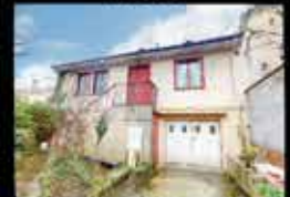
Montfermeil - Franceville 75m 2 hab, 2 chambres, 500m 2 de terrain, chauffage Gaz, DPE NC 252 000€*