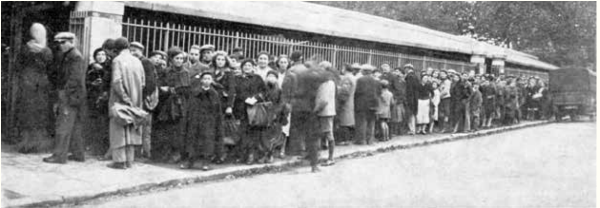
→ La queue pour accéder au marché de Barrière Blanche.

personnes qui pourront le moment venu prendre les armes pour combattre les Allemands et soutenir l'effort des Alliés. L'information des services anglais devient prioritaire. Des femmes et des hommes de notre commune participent à ces combats.