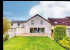
Montfermeil - Les Coudreaux 145m 2 hab, 4chambres, 500m 2 de terrain, chauffage Gaz, DPE C 427 000€*