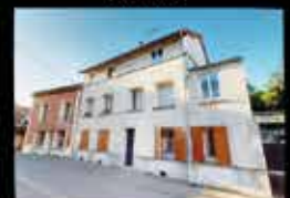
Montfermeil - Centre ville 40m 2 hab, 1chambres, chauffage elect, DPE E 129 000€*