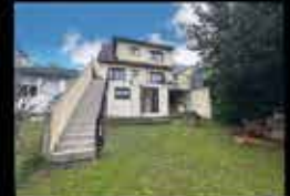
Montfermeil - Arboretum 109m 2 hab, 4 chambres, 375m 2 de terrain, chauffage gaz DPE E 331 000€*