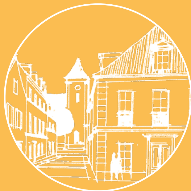
Centre-Ville ancien (projection architecturale)

Cet équipement offrira notamment une salle de spectacle, un pôle média, un café et un centre de documentation.