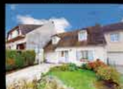
Montfermeil - Franceville 90m 2 hab, 3chambres, 500m 2 de terrain, chauffage Gaz, DPE C 325 000€*