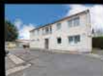
MONTFERMEIL - ZAC VAUCANSON Bureaux - 57 m 2 - Parking 2 bureaux à louer Honoraire : 1046,29€ - DG : 1950€ Loyer : 740€ HT