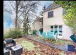
Montfermeil - Les Coudreaux 63m 2 hab, 2 chambres, 100m 2 de terrain, chauffage gaz DPE NC 246 000€*