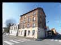
MONTFERMEIL - CENTRE-VILLE Appartement - Meublé 1 chambre - 49m 2 Honoraire : 642,29€, DG : 1300€ Loyer : 850€ TTC

" Confier votre bien à notre agence immobilière, c'est profiter de sérénité : gestion simplifiée, loyers sécurisés et experts à votre service au quotidien "