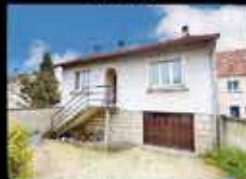
Montfermeil - Les Coudreaux 71m 2 hab, 3chambres, 185m 2 de terrain, chauffage gaz, DPE D 266 000€*