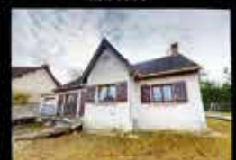
Montfermeil - Les Coudreaux 110m 2 hab, 4 1 / 2 chambres, 198m 2 de terrain, chauffage Gaz, DPE NC 304 000€*

LOCATION - GESTION - ASSURANCE LOYERS IMPAYES 01.82.37.01.39