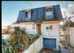
Montfermeil - Arboretum 120m 2 hab, 4 chambres, 408m 2 de terrain, chauffage gaz, DPE E 312 000€*