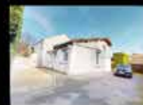
GAGNY - FRANCEVILLE 90m 2 hab, 2 chambres, 447m 2 de terrain, chauffage Gaz, DPE : D 368 000€*