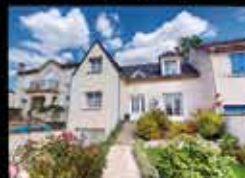
Montfermeil - Les Coudreaux 140m 2 , 4 chambres, 500m 2 de terrain, chauffage gaz DPE C 379 000€*