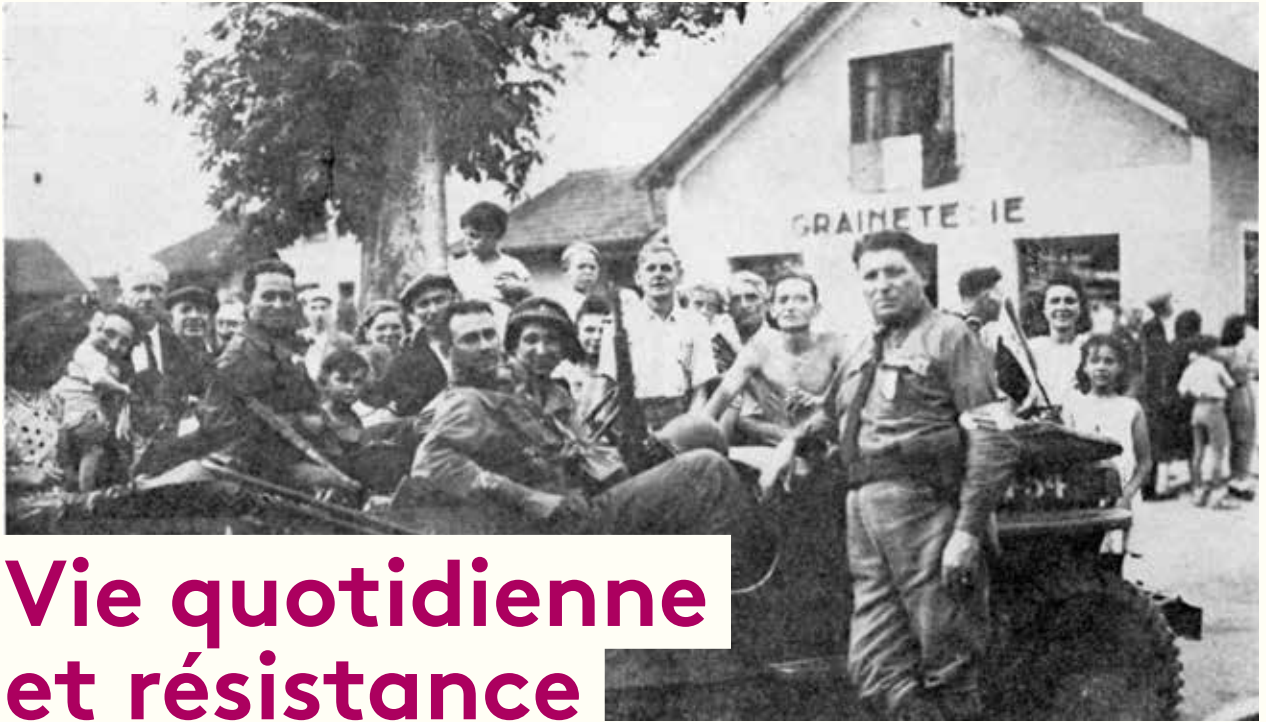
Août 1944 - Les soldats américains à Barrière Blanche.