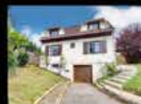
CHAMPIGNY-SUR-MARNE Maison - 4 chambres - 91m 2 - 312m 2 de terrain Honoraire : 1185,96€ - DG : 1900€ Loyer : 1900€ TTC